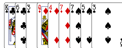
"Munken" (Syd) - udspil